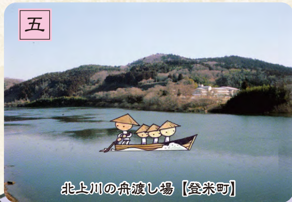
北上川の舟渡し場【登米町】