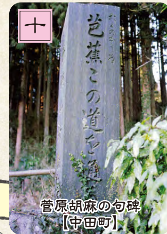
菅原胡麻の句碑【中田町】