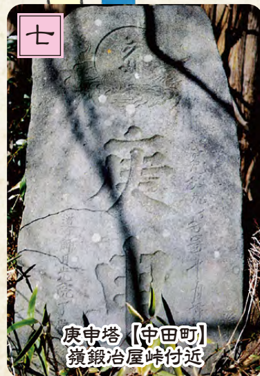
庚申塔【中田町】 嶺鍛冶屋峠付近