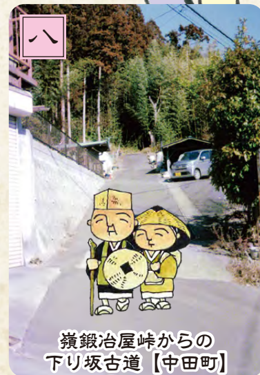
嶺鍛冶屋峠からの 下り坂古道【中田町】