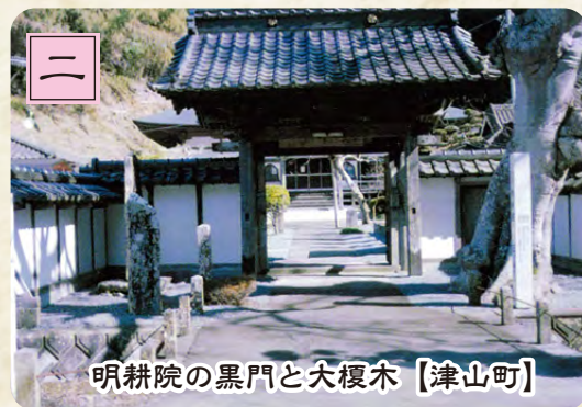
明耕院の黒門と大榎木【津山町】