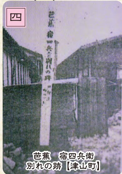
芭蕉 宿四兵衛 別れの跡【津山町】