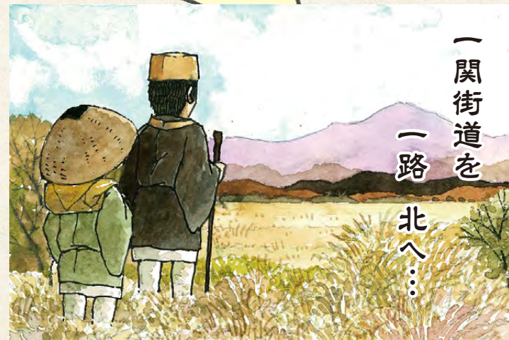
一関街道を 一路 北へ...