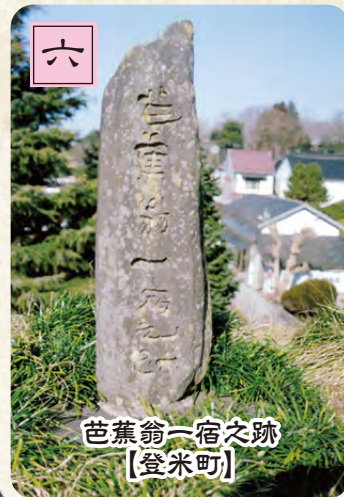
芭蕉翁一宿之跡【登米町】