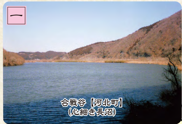
合戦谷【河北町】 (心細き長沼)