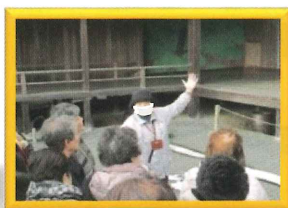
ベテランガイドさんの講習