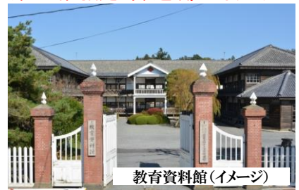
教育資料館(イメージ)