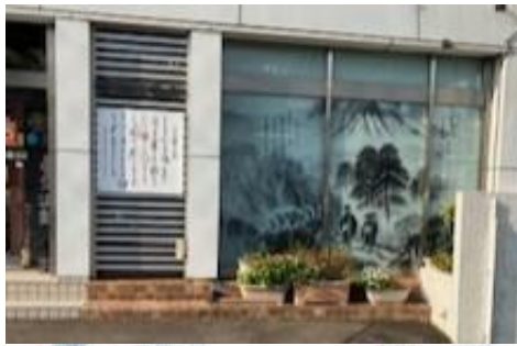
「はたけなか製麺」ショーウィンドウの全景