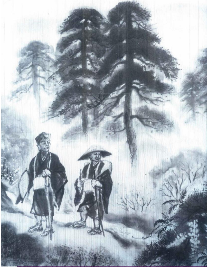
「奥の細道 — 白石行脚の図」芭蕉と曾良の部分 三枚のタペストリーからなる大作(縦が約2m 横が約3m) 水墨で描かれた枯淡の境地をご堪能ください